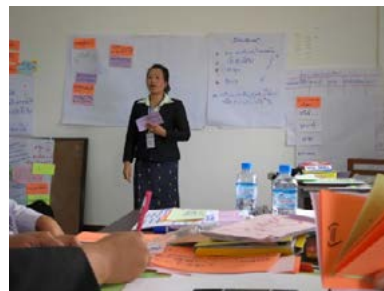
เจ้าหน้าที่ป่าไม้จังหวัดเพคหวุง เข้าร่วมในการอบรมความเที่ยงธรรมจัดโดย LBA

ในสาธารณรัฐประชาธิปไตยประชาชนลาว LBA ได้นำเงินสนับสนุนจากกองทุน GMCF มาใช้ในการจัดอบรมให้กับผู้ฝึกอบรม (Training of Trainers) เป็นหลัก กลุ่มเป้าหมายของพวกเขาคือเจ้าหน้าที่ภาครัฐในระดับท้องถิ่นผู้ซึ่งมีปฏิสัมพันธ์และทำงานกับชุมชนในการบริหารจัดการทรัพยากรป่าไม้รอบๆ บริเวณพื้นที่อนุรักษ์