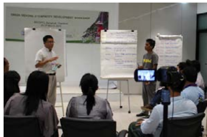
ผู้เข้าร่วมในการอบรม CSOs บันทึกการทดลองเป็นวิทยากรกระบวนการของตนสำหรับการประเมินรายกลุ่ม

ผู้แทนองค์กรภาคประชาสังคมที่เป็นพันธมิตรของ GREEN Mekong และทำงานร่วมกับป่าชุมชนในภูมิภาคแม่น้ำโขงตอนล่าง ได้เข้ารับการอบรมเชิงปฏิบัติการอย่างต่อเนื่อง เพื่อพัฒนาบทบาทการเป็นวิทยากรกระบวนการในระดับรากหญ้าของตน ผลลัพธ์ที่ได้คือการทำหน้าที่ที่มีความตั้งใจส่งเสริมการเข้ามามีส่วนร่วมของชุมชนอย่างเที่ยงธรรมได้อย่างมีนัยยะสำคัญมากขึ้น และพวกเขายังสามารถสร้างสภาพแวดล้อมที่สนับสนุนให้ผู้มีส่วนได้ส่วนเสียต่างๆ สามารถแสดงความคิดเห็นและมีส่วนร่วมในการตัดสินใจในกิจกรรมที่เกี่ยวข้องกับป่าไม้และการเปลี่ยนแปลงสภาพภูมิอากาศที่มีผลกับพวกเขาได้อย่างมีประสิทธิภาพ