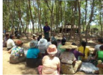
เจ้าหน้าที่จาก METTA เข้าเยี่ยมชุมชนเป้าหมายถึง 10 ชุมชนและได้พบกับผู้นำชุมชนและสมาชิก MRMC เพื่อแบ่งปันและส่งเสริมแนวคิดกระบวนการการบริหารจัดการทรัพยากรป่าโกงกางอย่างเที่ยงธรรม

นอกเหนือจากกิจกรรมเสริมสร้างศักยภาพเพื่อการธรรมภิบาลอย่างเที่ยงธรรมแล้ว ในตัวกระบวนการการจัดอบรมเชิงปฏิบัติการของ METTA เองก็ยังคงดำเนินไปด้วยความเที่ยงธรรม มีการประสานงานอย่างใกล้ชิดกับชุมชน เพื่อให้แน่ใจว่ามีความรู้และชาวประมงรายเล็กผู้ที่พึ่งพาป่าโกงกางธรรมชาติเพียงอย่างเดียวในการดำรงชีพนั้นได้เข้าร่วมด้วย ในระหว่างการจัดการประชุมเชิงปฏิบัติการ ผู้เข้าร่วมได้แบ่งปันประสบการณ์การพัฒนาและการพึ่งพาทรัพยากรธรรมชาติ จากกิจกรรมนี้กลุ่มผู้มีส่วนได้ส่วนเสียหลายกลุ่มได้มีความเข้าใจซึ่งกันและกันมากขึ้น และเข้าใจว่าเหตุใดการมีส่วนร่วมของคนจึงมีความสำคัญ