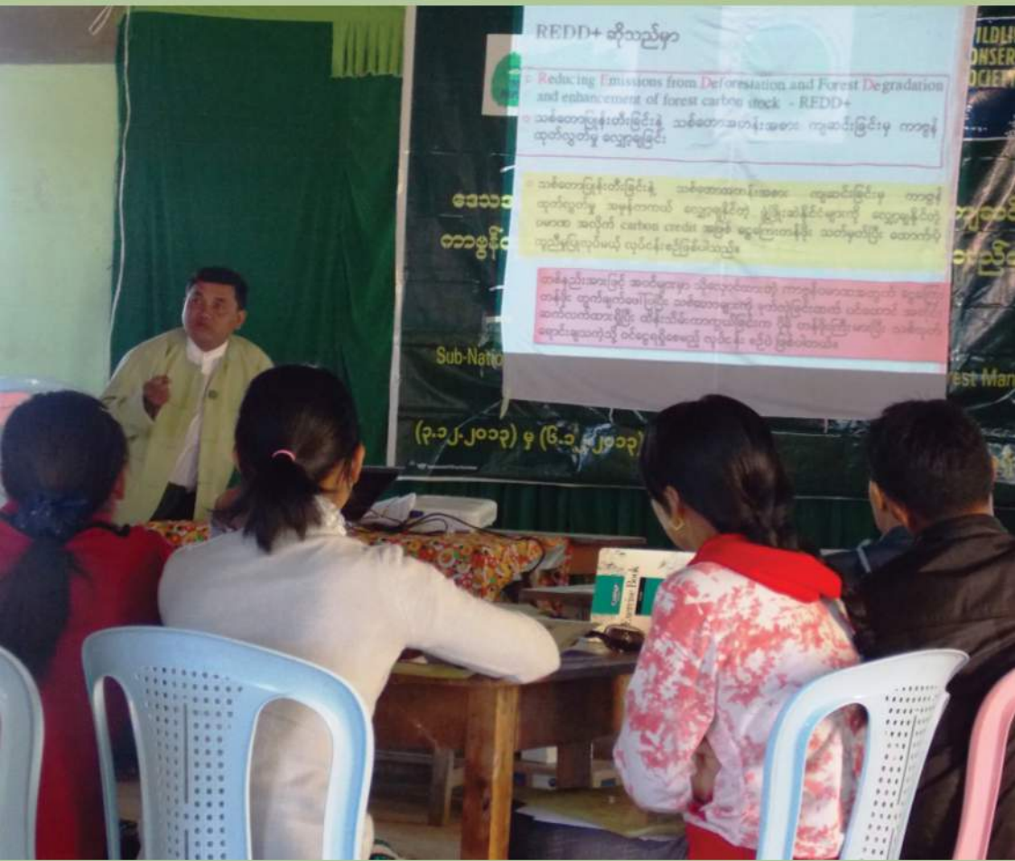
အပိုင်း (၄) စွမ်းဆောင်ရည်တိုးတက်စေခြင်း